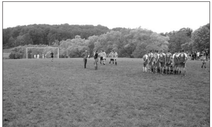
The 34th Annual Slovak Heritage Festival featured an all-day soccer tournament.