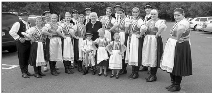
Folklorný súbor PAS z Pittsburghu, PA.